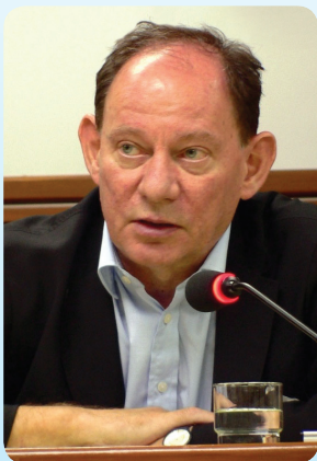
McMillan Scott, podpredseda Európskeho parlamentu

„Prenasledovanie je politicky motivované a jeho obeťami sú väčšinou bežní ľudia, ktorí len pokojne uplatňovali svoje základné práva na slobodu presvedčenia, zhromažďovania a prejavu.“ Amnesty International