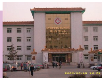
Bolnica-zatvor u Sujiatunu, gde su do nedavno čuvani zatvorenici, pre nego što bi po potrebi bili stavljeni na operacioni sto.

U proteklih osam godina, između 300.000 i 1.000.000 ljudi je protivzakonito uhapšeno, mnogi su mučeni u radnim logorima, duševnim bolnicama i zatvorima. Potvrđeno je skoro 4.000 smrti, a smatra se da su prave brojke mnogo veće. Praktikanti se novčano kažnjavaju, otpuštaju s posla, izbacuju iz obrazovnih ustanova, primoravaju da se razvedu i da napuštaju sopstvene domove.