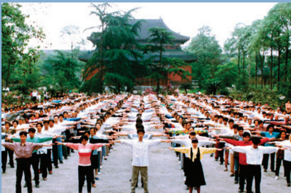
Nekada uobičajen jutarnji prizor u Kini

Falun Gong, poznat i kao Falun Dafa, je praksa meditacije, sporih vežbi, i odgajanja istinitosti, blagosti i trpeljivosti u sebi. Ove tri vrednosti čine kičmu učenja Falun Gong. Praktikanti nastoje da ih se pridržavaju u svakodnevnom životu, kako bi vremenom dostigli visok stupanj harmonije sa svetom oko sebe i unutrašnju ravnotežu.