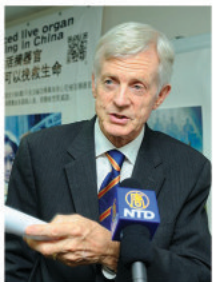
David Kilgour, były kanadyjski Sekretarz Stanu, prowadził dochodzenie w sprawie grabieży organów od praktykujących Falun Gong w Chinach.

Grabież organów od więźniów sumienia: praktykujących Falun Gong