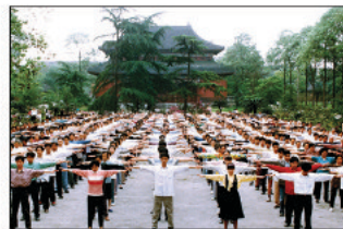
Poranne ćwiczenia Falun Gong w mieście Chengu, 1998 r. W latach 90-tych grupowe ćwiczenia Falun Gong odbywały się codziennie w parkach każdego większego miasta w Chinach.

W latach 90-tych, Falun Gong stał się dla większości społeczeństwa chińskiego ulubioną metodą ćwiczenia ciała i doskonalenia umysłu. Był w tym czasie wspierany przez władzę. W 1999 r. uprawiało go prawie 100 milionów ludzi. Jednakże w lipcu 1999 r. KPCh rozpoczęła represje wobec Falun Gong, bojąc się, że jego popularność i propagowanie tradycyjnych wartości staną się przeszkodą w kontrolowaniu społeczeństwa